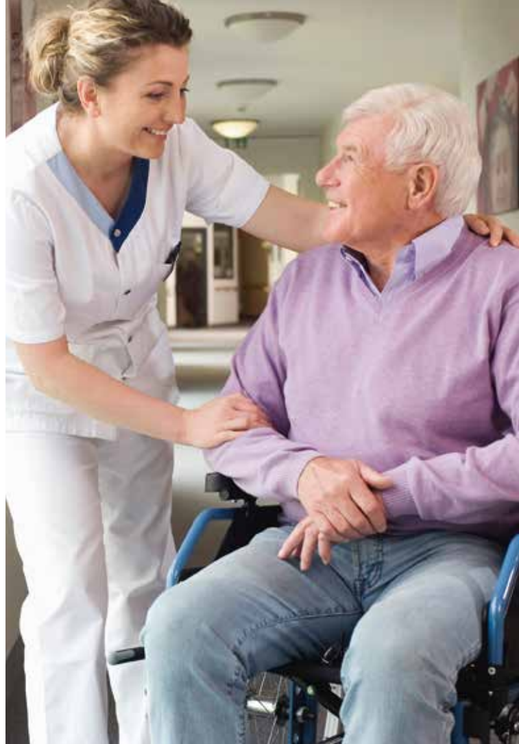
V.U.: Damiaan, Pater Damiaanstraat 39, 3120 Tremelo. Niet-bindende foto's.