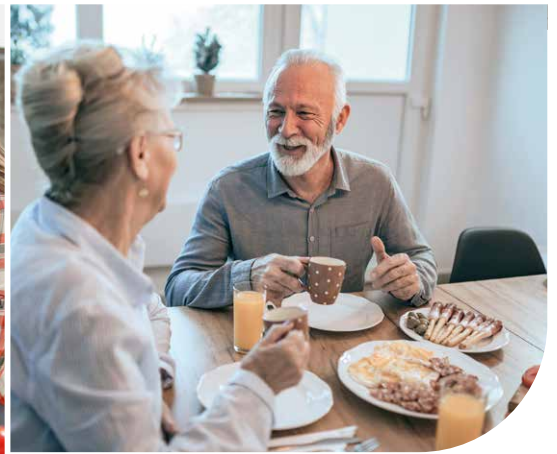
V.U. De Fakkel, Tessenderlosesteenweg 143, 3583 Paal. Niet-bindende foto's.